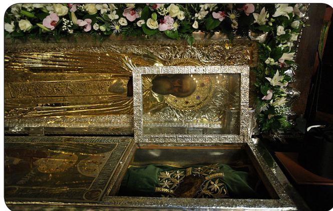
Рака с мощами преподобного Сергия Радонежского