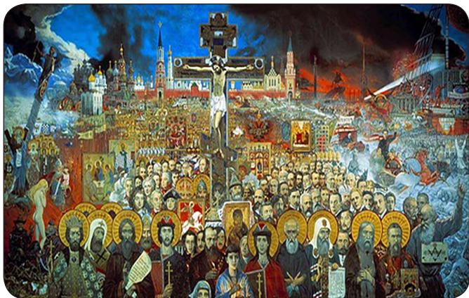
Илья Глазунов. Вечная Россия

...В конце II века христианским апологетом Тертуллианом были сказаны слова, ставшие крылатыми