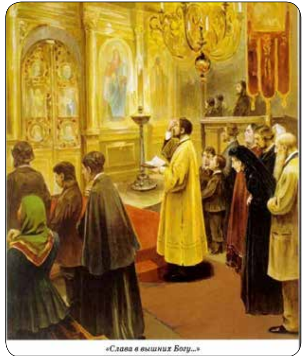
«Слава в вышних Богу...»

Во-первых, сразу за полиелеем начинается чтение канонов – особых больших по объему молитв, где развернуто и глубоко раскрывается духовный смысл празднуемого события или жития святого (святых), несколько