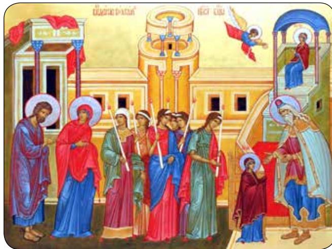
4 декабря - Введение во храм Пресвятой Богородицы

Она ребенком была введена во храм. И этот праздник в Православной Церкви празднуется как праздник детей, не только чистоты детства, но ещё и чистоты девства. Редко кому даётся в жизни сохранить девство тела. Но, по крайней мере, девство души мы должны беречь, по крайней мере, детскую душу, чистоту детской души должны стремиться сохранить в себе. Сегодняшний праздник нас зовёт к этому. И улыбается нам Пречистая Дева Мария своей поразительной, не только приснодевственной,