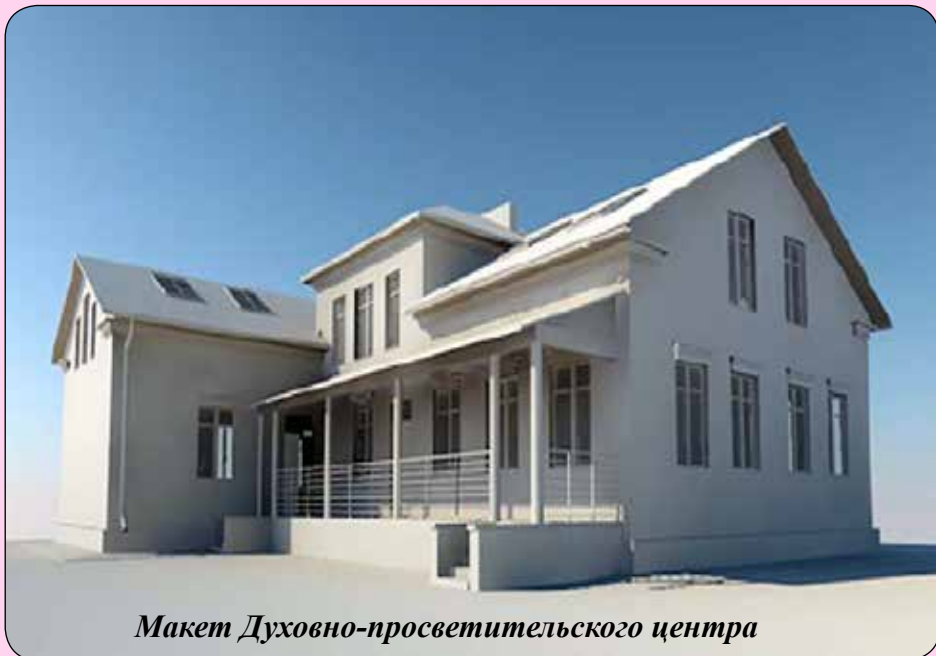
Макет Духовно-просветительского центра

или иное доброе дело. Жертвуя на строительство нашего Духовно-просветительского центра, вы будете участвовать в самом благом деле – спасении и воспитании наших детей. Вы сможете внести своё имя в историю дела святого созидания.