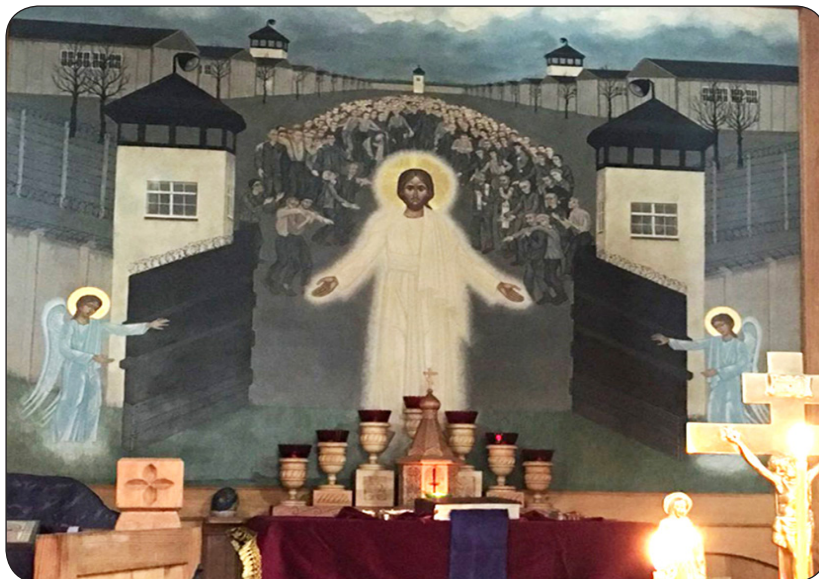
Икона в часовне на территории бывшего концентрационного лагеря Дахау

За всю историю Православной Церкви не было такого пасхального Богослужения, как 6 мая 1945 году в Дахау – День памяти великого православного святого и воина Георгия Победоносца! Самодельные ризы священников из полотенец с нашитыми боль-