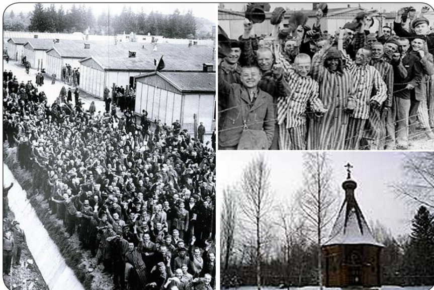
Пасха в Дахау