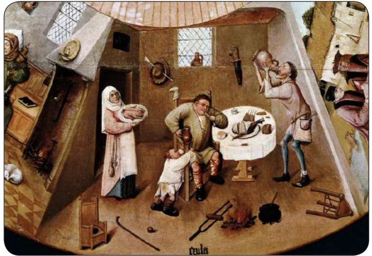
Иероним Босх. Семь смертных грехов 1475-1480 гг. Чревоугодие. Фрагмент.

Когда придет тяжелое время, говорит старец Паисий Святогорец, не будут испытывать трудностей те, кто привыкли молиться и потреблять простую пищу, благословленную молитвой. А тяжело будет тем, кто привык к тортам и сырам, кто привык ни в чем себе не отказывать и никогда даже не вспоминал о молит-