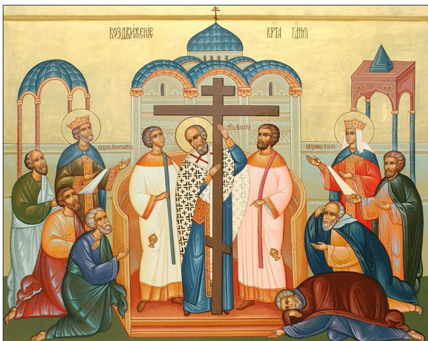
27 сентября - Воздвижение Честного и Животворящего Креста Господня

Эти чудеса произошли по молитве святителя Ма-