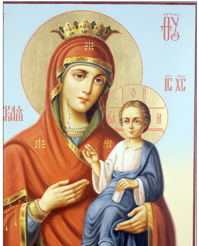
25 февраля — Иверской иконы Божией Матери

Вот о каком хранении Божией Матерью всей жизни нашей напоминает явление иконы Ее Иверской. Она охраняет как бы все входы и исходы нашей жизни и потому называется «благой Вратарницею, райские двери всем отверзающею». Как бы в знамение того Она и избрала себе место под вратами обители Иверской, что хочет Она охранять жизненные входы и исходы человека. Так и в Москве Она охраняет как бы входы и выходы народа русского, стекающегося отовсюду «в сердце России», столичный город ее Москву. Так и здесь, во Владикавказе, самый храм, устроенный вблизи базара, напоминает о том, как необходимо все свои входы и исходы движущемуся здесь непрестанно народу осенять небесным благословением благой Вратарницы, Божи-