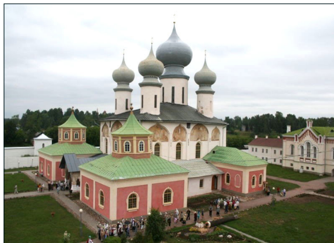
Успенский собор Тихвинского монастыря

Благодатные явления от Тихвинской иконы не прекращаются и по сей день. Три года назад в московском Новодевичьем монастыре произошло но-