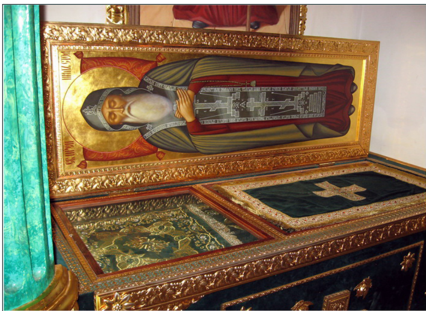
Рака с мощами святого преподобного Нила Столобенского

другие плоды леса. Бесы, чтобы устрашить святого и прогнать его из пустыни, являлись ему в виде свирепых зверей и гадов. Они с пронзительным свистом и шипением устремлялись на него, но святой подвижник отгонял их молитвой и крестным знаменем. Не имея возможности изгнать преподобного из пустыни, бесы научали злых людей причинять ему вред. Однажды к святому отшельнику пришли разбойники, думая найти у него какие-либо сокровища. Узнав об их приходе, преподобный Нил сотворил молитву и вышел им навстречу с иконой Божией Матери в руках. Разбойникам показалось, что с преподобным идет множество вооруженных людей. Они испугались и стали просить у святого прощения. Святой Нил с любовью принял их покаяние и отпустил с миром.