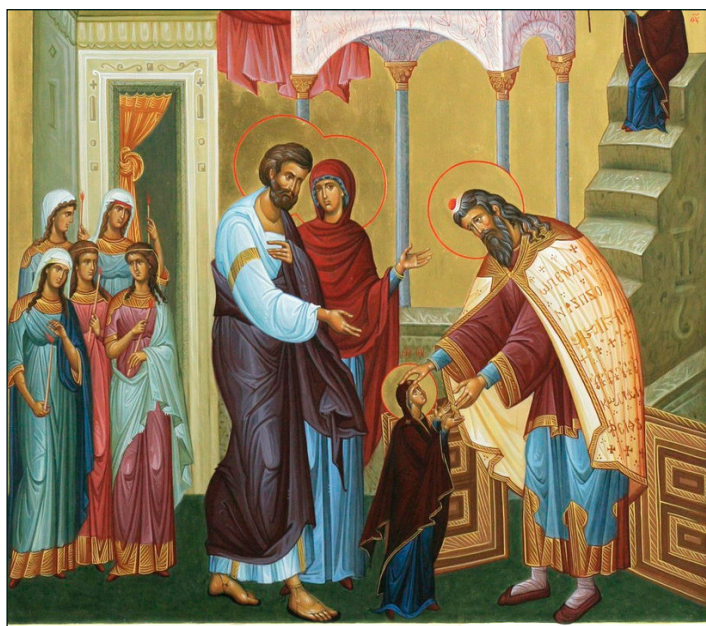
4 декабря — Введение во храм Пресвятой Богородицы

виг совершенную любовь и совершенную кротость перед Богом. И что самое главное, посмотрите, в 44-ом Псалме с 10-го по 13-й стих, святой пророк и царь Давид подчеркивает и возвышает Славу Пресвятой Богородицы: Слыши, Дщи, и виждь, и приклони ухо Твое..., яко возжелает Царь доброты Твоя... Какой Царь? Царь Небесный! Сам Господь возжелает Ее доброты! Почему? И последняя строка: Вся слава Дщере Царевы внутрь... (Пс. 44, 10 — 13). Вся Слава Матери Божией — это Ее совершеннейшая, чистая, воз-