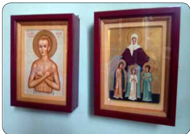
Иконы святых мучениц Веры, Надежды, Любви и матери их Софии, а также праведного Иакова Боровичского, Новгородского чудотворца

С тех пор как существует православное христианство существует традиция написания икон.