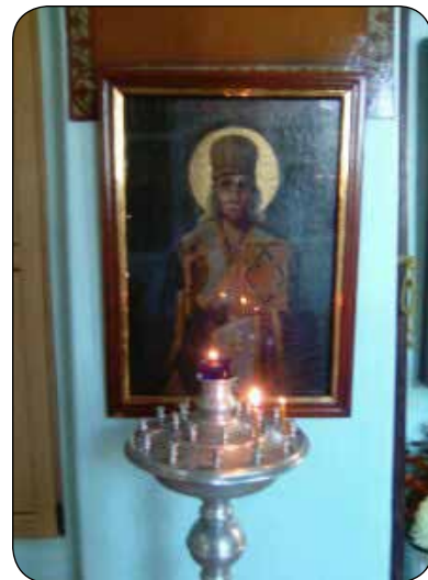
Икона святителя Никиты епископа Новгородского

Первым стал учил меня рисовать мой отец. Он был художник-самоучка, а позже я стал заниматься в детской художественной школе.