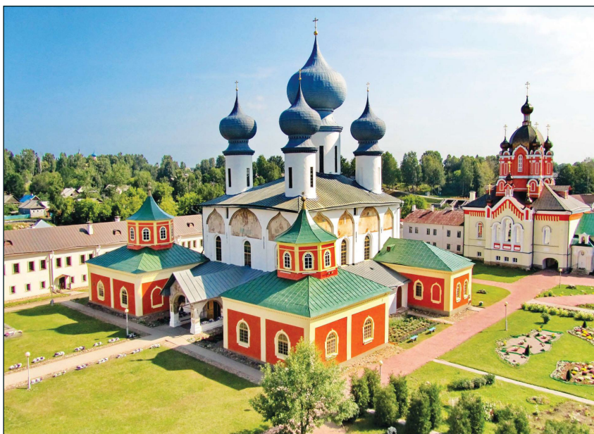
Тихвинский Богородичный Успенский монастырь

иконы. Впоследствии этот список был принесен в Москву и поставлен в Успенском соборе, а затем по просьбе новгородцев, участников войны со шведами, отправлен в Новгород и поставлен в Софийском соборе. Так с начала XVII века началось всероссийское почитание Тихвинской иконы Божьей Матери.