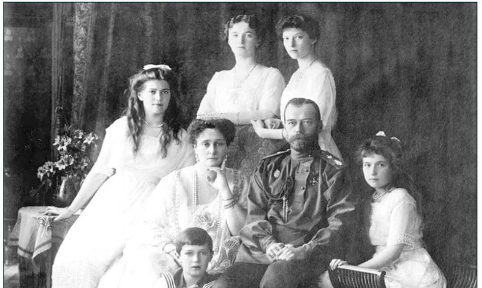
Семья Николая II: Александра Федоровна и дети — Ольга, Татьяна, Мария, Анастасия и Алексей. 1913 г.

Последний российский император Николай II Романов отрекся от престола 2 марта 1917 года. После отречения его вместе с семьей, врачом и слугами заключили под домашний арест во дворце в Царском селе. Потом, летом 1917-го, Временное правитель-