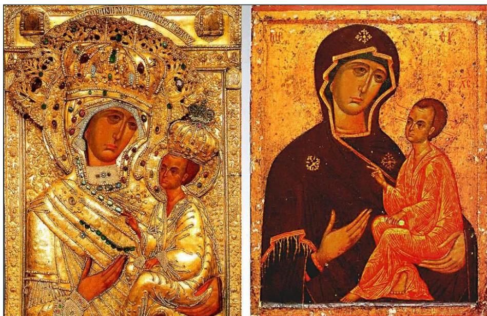
9 июля — Тихвинской иконы Божией Матери

Т ихвинская икона Божией Матери, по преданию, одна из икон, написанных святым апостолом и Евангелистом Лукой. В V в. из Иерусалима была перенесена в Константинополь, где для нее был построен Влахернский храм. В 1383 году, за 70 лет до взятия турками Константинополя, икона исчезла из храма и в лучезарном свете явилась над водами Ладожского озера. Чудесно носимая с места на место, она остановилась близ города Тихвина. На месте явления иконы был построен деревянный храм в честь Успения Богородицы. Усердием великого князя Василия Ивановича (1505–1533) вместо деревянного храма был возведен каменный. В 1560 го-ду по приказу царя Иоанна Грозного при храме был устроен мужской монастырь, обнесенный каменной стеной. В 1613–1614 годах шведские войска, захватив Новгород, не раз пытались уничтожить монастырь, но заступлением Божией Матери обитель была спасена. Так, однажды, в виду приближавшегося шведского войска, иноки решили бежать из монастыря, взяв чудотворную икону, но не могли сдвинуть ее с места. Это чудо остановило малодушных, и они остались в монастыре, уповая на защиту Божией Матери. Незначительные по числу