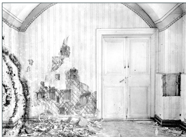
Подвал дома Ипатьева, Екатеринбург. В ночь с 16 на 17 июля 1918 г. здесь был расстрелян вместе с семьей и домочадцами император Николай II

21 июля 1918 года во время богослужения в Казанском соборе в Москве Патриарх Тихон сказал: «На днях свершилось ужасное дело: расстрелян бывший Государь Николай Александрович... Мы должны, повинувшись учению слова Божия, осудить это дело, иначе кровь расстрелянного падет и на нас, а не только на тех, кто совершил его. Мы знаем, что он, отрекшись от престола, делал это, имея в виду благо России и из любви к ней. Он мог бы после отречения найти себе безопасность и сравнительно спокойную жизнь за границей, но не сделал этого, желая стра-