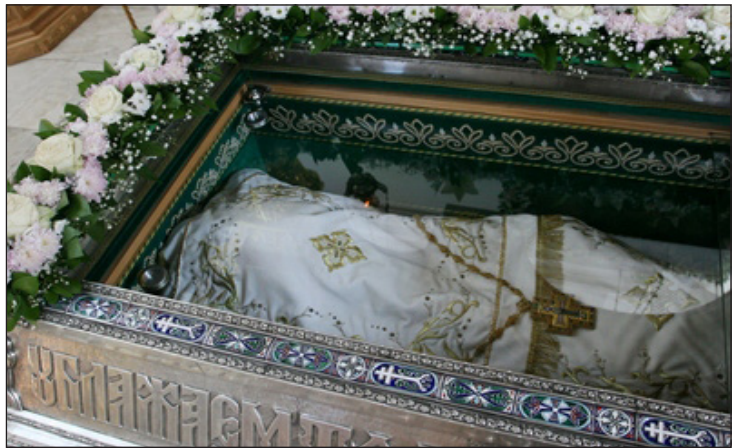
Святые мощи преподобной Евфросинии Полоцкой

Неподалеку от Спасской обители преподобная Евфросиния воздвигла другую каменную церковь – в честь Пресвятой Богородицы. «И ее создав, украсила иконами и, освятив, передала монахам, – и был мо-