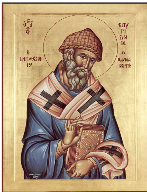
25 декабря — память свт. Спиридона, еп. Тримифунтского, чудотворца

го слова книг Священного Писания. В наши дни, когда «необновленцы» все настойчивей говорят о возможности критического отношения к богодухновенным книгам и требуют «русификации богослужения», поучительно звучит его обличение некоего Трифиллия, человека весьма изошённого в красноречии и книжной премудрости. Во время проповеди о расслабленном тот заменил евангельские слова Спасителя: «востани и возьми одр твой» (Мк. 2, 12) на «востани и возьми ложе твое». Не вынося изменений слов Писания, святитель сказал Трифиллию: «Неужели ты лучше сказавшего «одр», что стыдишься этого слова?» «Все, что приняла святая Церковь, должно быть любезно сердцу христианина», – говорит преподобный Серафим Саровский. И все святые Отцы заповедуют нам: «Золото принял, золото и передай».