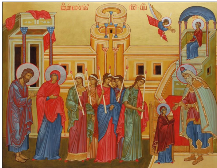
4 декабря — Введение во храм Пресвятой Богородицы

И не только мы видим то, что Она всегда предстояла мысленно перед Богом, а и то, что Она всегда везде соучаствовала в любви и милосердии к ближнему, всегда помогая людям вот с таких детских лет, посылно. Когда уже Она стала возрастать, Она все делала Своими руками по послушанию и всегда помогала нищим, питая их. Это, конечно, было деланием всех девиц, которые проживали до 14-ти лет при священном храме в Иерусалиме, но