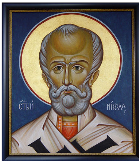
19 декабря — Преставление святителя Николая, архиепископа Мир Ликийских, чудотворца

Откликнулось человечество на эти святые призывы своего Спасителя? Да, откликнулось — в лице Апостолов, святителей, мучеников, преподобных и всех истинных последователей Христовых. Смиранные сердца их приняли Его заветы и принесли богатые и обильные плоды. Смирение стало корнем, из которого произрастают прочие плоды святой веры. Смирение вознесло людей, низвело на них многообразные дары благодати и прославило их в Царствии Небесном. Вот в числе таких смиренных и кротких деятелей и подвижников добродетели и является чествуемый ныне Церковью Святитель Христов Николай, великий угодник Божий, который, услышав о Христе и о Его спасительном учении, пошел неуклонно и верно за Ним, в точности исполняя евангельские заповеди и во всем стараясь подражать своему Владыке.